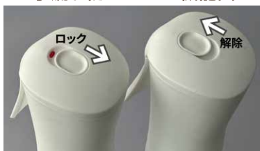
水漏れ防止ロック機能画

ロック機能があり、カバン内等での水漏れを防止し携帯に便利です。 熱中症予防にお勧めください。